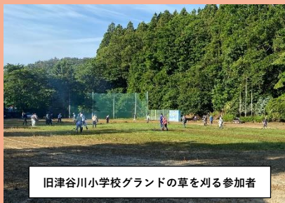
旧津谷川小学校グラウンドの草を刈る参加者

環境整備は毎年春と秋の2回行われ、持ち回り制のため、今秋は上津谷川と竹野下の自治会の方々が実施するとの事です。